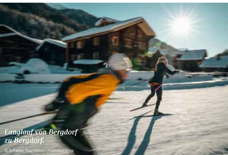
Langlauf von Bergdorf zu Bergdorf.