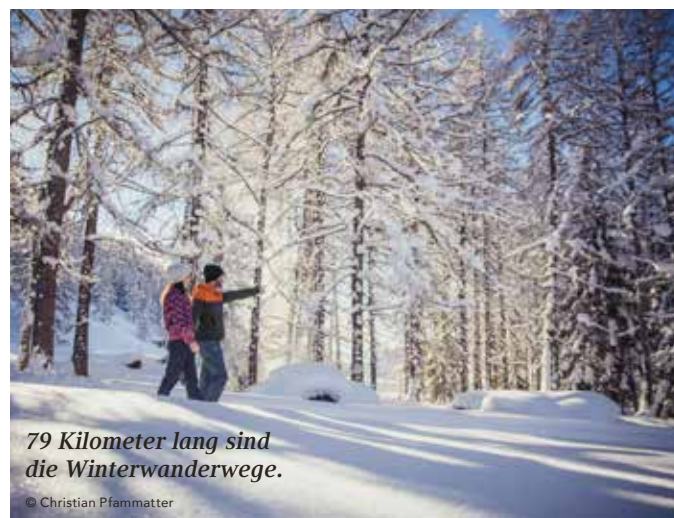
79 Kilometer lang sind die Winterwanderwege.